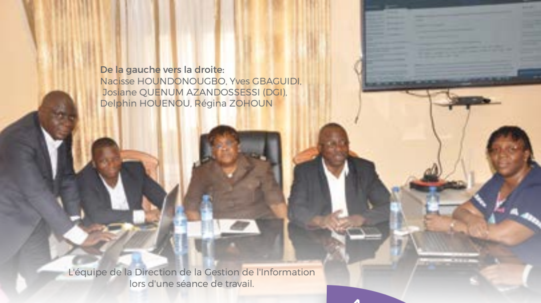
L'équipe de la Direction de la Gestion de l'Information lors d'une séance de travail.