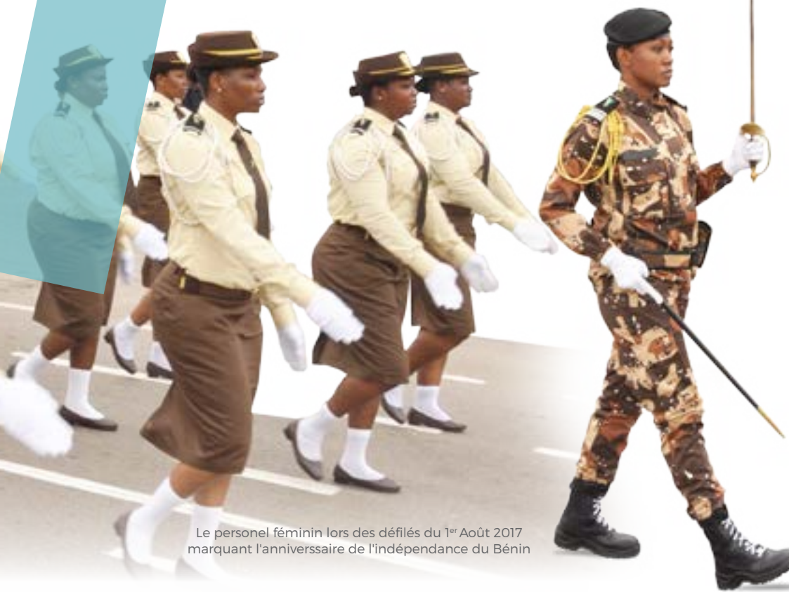
Le personnel féminin lors des défilés du 1 er Août 2017 marquant l'anniversaire de l'indépendance du Bénin

L'Administration des douanes est l'une des régies financières les plus importantes en République du Bénin. Investie de plusieurs missions, elle dispose d'un effectif de huit cent quatre vingt douze (892) fonctionnaires qui se battent de jour comme de nuit pour atteindre les objectifs à eux assignés.